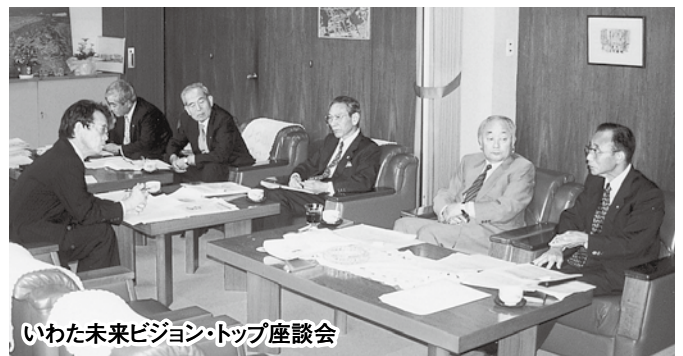
いわた未来ビジョン・トップ座談会