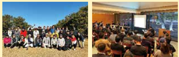
親睦ゴルフ大会と1月例会のようす