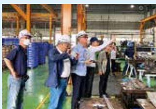
▲(株)遠州タイ工場内の視察の様子

(株)遠州タイ工場では、主にシートベルトの金具部品を製造しており、機械の稼働状況や原材料などの在庫状況がモニターでリアルタイムに確認でき、自社で開発・設計した管理システムを導入することで生産効率の向上を図っていました。参加者は「IT・オートメーション化された工場内を実際に見学することができ、自社もこのようなシステムを参考にIT化を進めるきっかけにしたい」と語っていました。