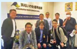
▲浜松磐田信用金庫バンコク駐在員事務所にて

浜松磐田信用金庫バンコク駐在員事務所では、タイに進出を希望する企業をサポート体制やタイの経済状況を伺い、自動車産業のEV化における業界全体の動向や日系企業の現状を肌で感じることができました。視察全体を通して、タイの国民性を尊重し従業員がより働きやすさを意識した労働環境を整えることで、日本とタイのそれぞれが持つ企業としての良さがマッチすることでよりグローバルな事業展開が可能になると感じました。