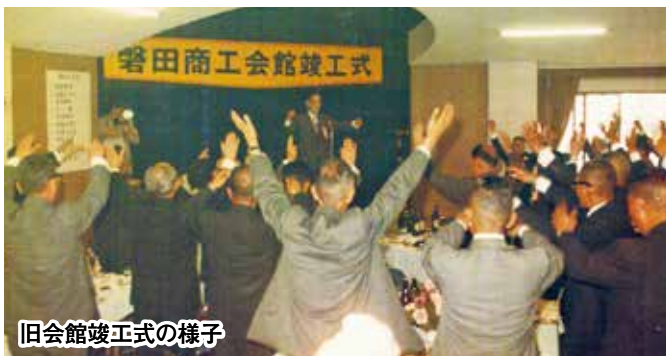
旧会館竣工の様子