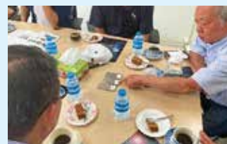
▲(株)オキソ事務所内にてサンプルを用いた説明