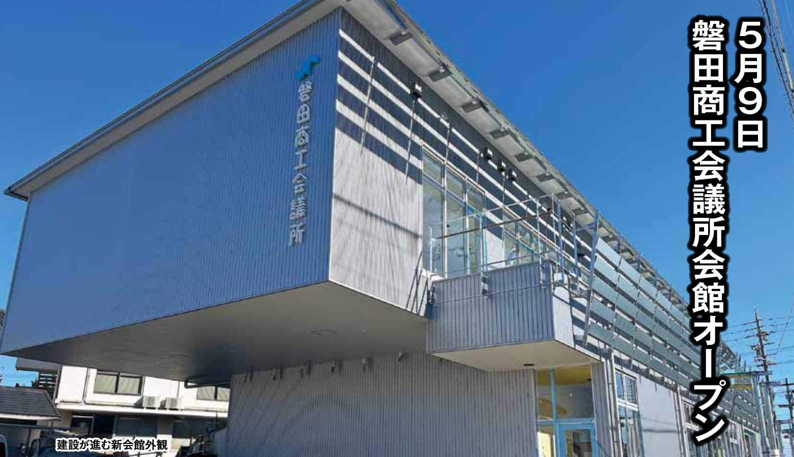
建設が進む新会館外観