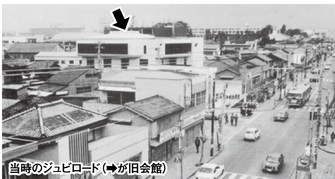
当時のジュビロード (→が旧会館)