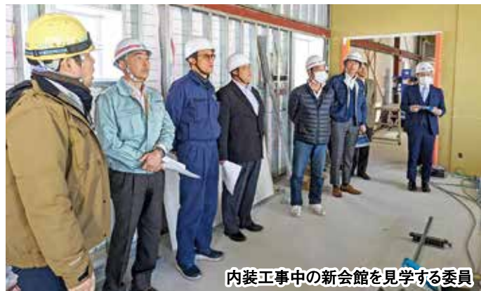
内装工事中の新会館を見学する委員

2月7日(木)に開かれた第20回磐田商工会議所会館建設推進委員会後に、現在工事中の新会館内を見学しました。外装工事は終盤を迎え、内装工事を進めているなか、推進委員の方々は、実際に新会館の現場に触れることで、新会館の利活用や新しい会議所のイメージを膨らませていました。