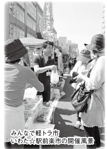
みんなで軽トラ市 いわた☆駅前楽市の開催風景

「みんなで軽トラ市いわた☆駅前楽市」、「いわた夏祭inジュビロード」、「宿場市」は引続き開催します。コロナ禍で疲弊している地域に明るい話題を提供していきます。ジュビロ磐田、静岡ブルーレヴズ、静岡SSUボニータをスポーツのまち磐田の「宝」として支援していきます。