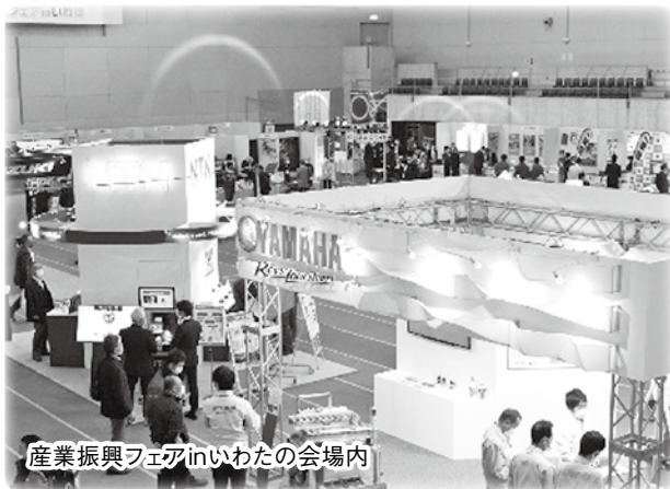
産業振興フェアinいわたの会場内

コロナ特別融資の元金返済がピークとなることから、マルチ融資をはじめとした公的融資制度の斡旋により、資金繰りの対応を支援していきます。