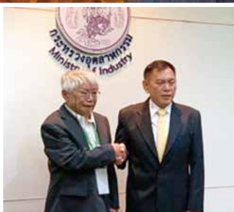
タイ工業省副大臣を訪問