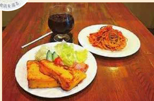
人気メニューのフレンチトースト、ナポリタン、アイスコーヒー