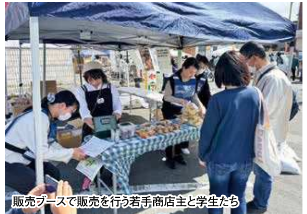
販売ブースで販売を行う若手店主と学生たち

今後は、今回のアンケート結果や学生から得た意見をもとに、実現可能な内容へと落とし込み、中心市街地活性化となる取り組みにつなげていきたいと考えています。そして若手店主たちは、創業希望者の支援やイベント開催を通じて、商店街を活気ある場へと育てていく意欲を燃やしています。