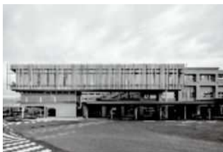
②: 磐田市立総合病院 研修棟 (2020)