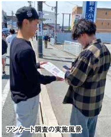
アンケート調査の実施風景

5月11日に開催したみんなで軽トラ市 いわた☆駅前楽市にて、磐田駅前商店街の若手店主が中心となり、商店街のにぎわい創出に向けた新たな取り組みを実施しました。今回の企画では、商品販売と来場者アンケート調査を行い、地域の声を直接聞くことで今後の活動に活かすことを目的としています。