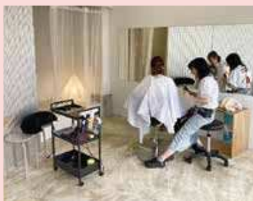
美容室「immi」7月15日より営業スタート