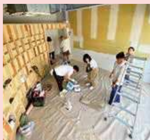
オープン準備の様子

磐田商工会議所としても、今後も中心市街地の賑わい創出に向けて、こうした取組を支援してまいります。