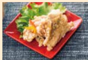
▲丁寧に仕込んだ塩から揚げは姫家の定番メニュー