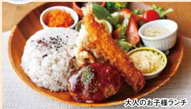
大人のお子様ランチ