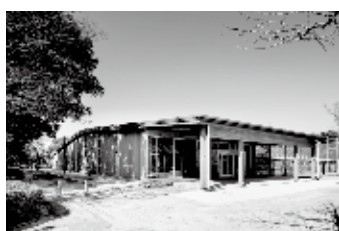
④：磐田卓球場 ラリーナ (2018)