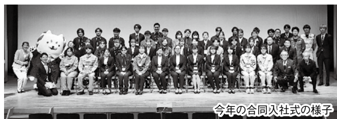
今年の合同入社式の様子

磐田市内の中小企業・小規模事業者に入社される新入社員の方を対象に、来年度も「合同入社式」を予定しています。