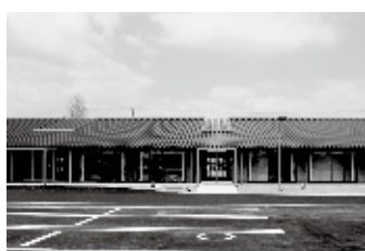
⑤：豊岡中央交流センター（2015）