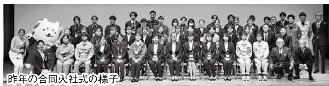
昨年の合同入社式の様子

磐田市内の中小企業・小規模事業者に入社される新入社員の方を対象に、来年度も「合同入社式」を予定しています。