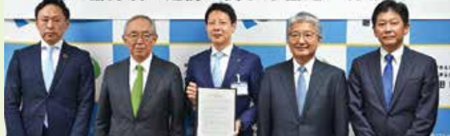
左からSFGマーケティング(株)代表取締役、静岡産業大学学長、草田市市長、高柳会頭、静岡銀行執行役員