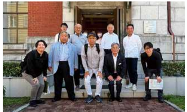
▲岡崎信用金庫資料館