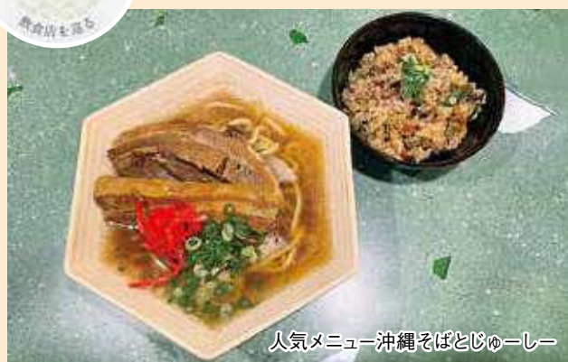
人気メニュー沖縄そばとじゅーしー