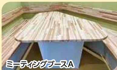
ミーティングブースA