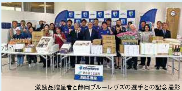
激励品贈呈者と静岡ブルーレヴズの選手との記念撮影

令和6年11月29日(金)に静岡ブルーレヴズ応援のため、会員企業を募り激励会を開催し、各事業所から贈呈品をお送りしました。