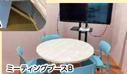
ミーティングブースB

オンライン会議や5人程度の打ち合わせにご利用いただけます。 事務所へお声がけいただくとその場でご利用できます。