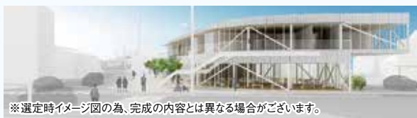
※選定時イメージ図の為、完成の内容とは異なる場合がございます。