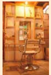
▲店内にある カットルーム

磐田駅から徒歩で行けますので、休日のお昼からビール片手にヘアカットしてみたいかかでしょうか。