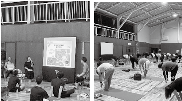
講師例会とアロマ・ヨガ体験会の様子

初めて体験会という形での例会となりましたが、参加した会員からは「自分の心・体と向き合うきっかけになった」「程よく汗がかけて体がスッキリした」などのご意見をいただきました。