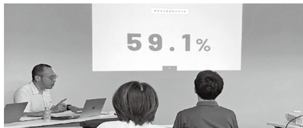
HPの影響力について説明している様子

8月8日(火)にHPに関する勉強会(個別相談含む)を開催しました。前半はHPに関する知識や必要性についてお話いただき、後半は参加者が持つ悩みや疑問について個別に回答していただきました。既にお持ちの素敵なHPを、この勉強会を機に、さらに有効的で使いやすいHP作成にご活用いただければと思います。こんなセミナーやってほしい!というご要望がありましたら、お気軽にご連絡ください。