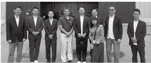
(株)小出製作所AI・FAラボ長崎にて

2日間を通じて、長崎市内の街並みや、歴史的背景、将来を見据えた取組を学ぶことができ、今後の日本の在り方を考えるきっかけとなりました。今後も当部会では、視察・セミナー等を開催していきますので、ご参加をお待ちしております。