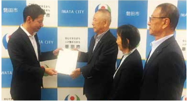
▲(左から)磐田市長、鈴木会頭、高橋副会頭、大橋副会頭