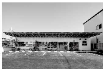
③: eco ランドリー+ 富士見町店(2021)