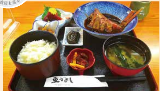
▲他では中々食べられないという金目鯛の煮付け