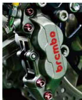
▲ブレーキキャリパー

15色の豊富なカラーパリエーションで自由なカスタマイズに対応。 サイズは、M3～M8までを展開。64チタン合金を使用したボルトを作成し、「陽極酸化処理」を施したカラー皮膜は薄く強度があり、高級感を演出します。 バイクのパーツをスタイリッシュにドレスアップし、個性を引き立てるアイテムです。